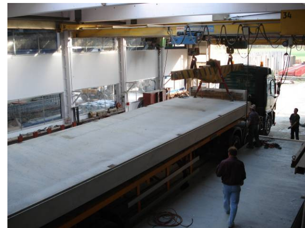
Fin du chargement