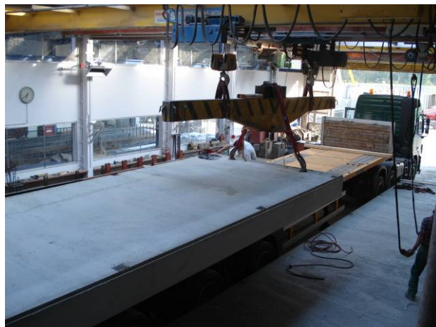
Pose de la pièce