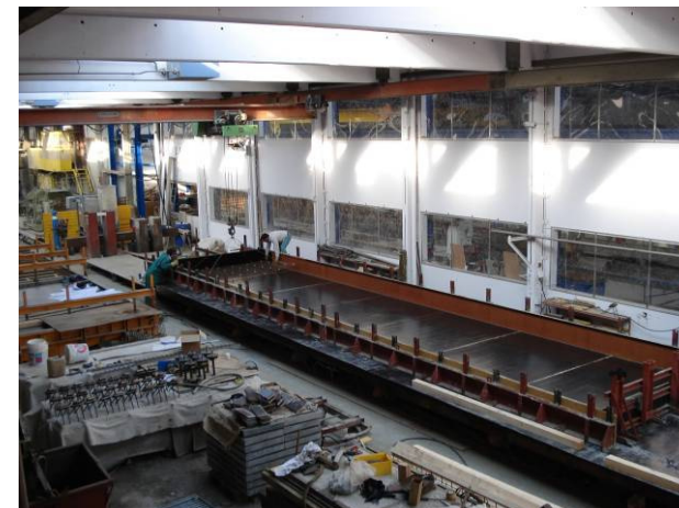
Coffrage prêt à recevoir l'armature