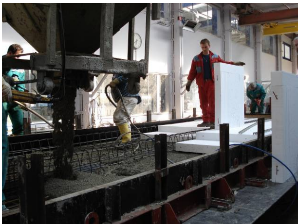
Bétonnage 1ère couche et isolation