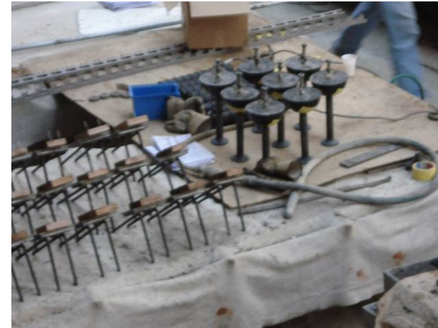
Incorporés de liaison et levage