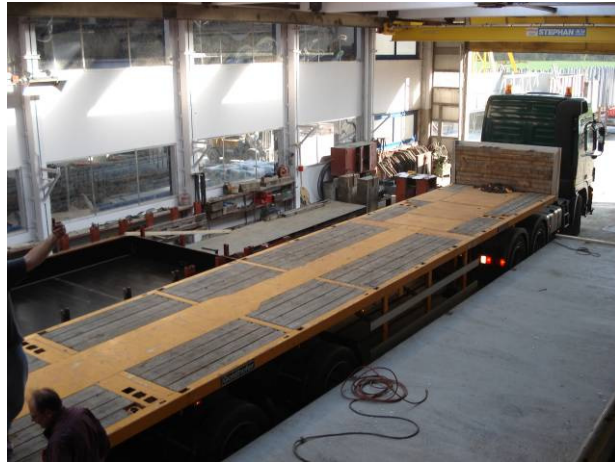
Camion en place