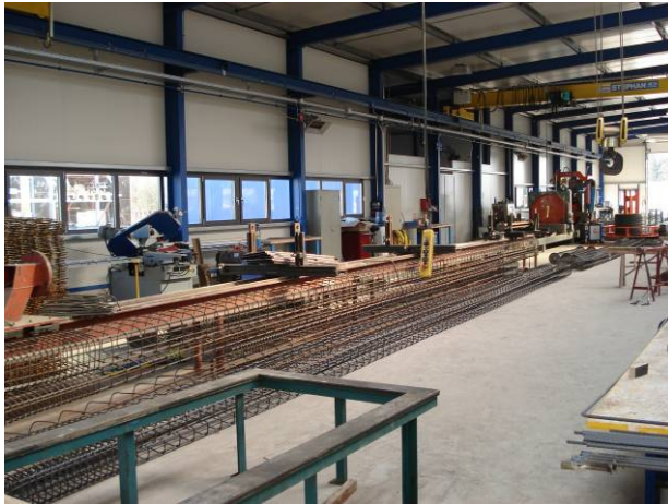
Armatures pour les âmes de la dalle