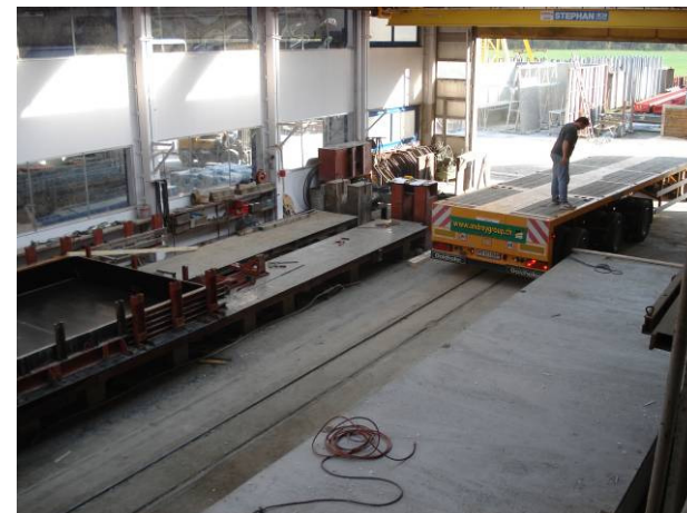
Camion dans la halle